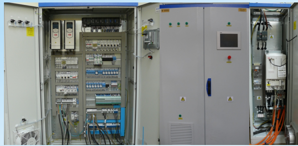
Instalație de forță și automatizare

Grupul de comprimare poate funcționa instalat în aer liber sau montat într-un container izolat fonic. În această variantă, sistemul electric de forță și de automatizare este montat de asemenea în container într-un compartiment separat, izolat complet de compartimentul unde este montat skid-ul compresor.